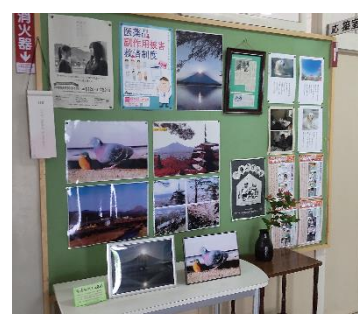
ダイヤモンド富士の写真など

職員玄関や校長室をはじめ、校内のいろいろなところに季節の花が生けられ、学校に彩を添えてくださっています。校長室の一輪挿しにはいつもきれいな花を生けてくださり、来校者の方に大好評です。7月5日の昼休みには、生徒向けの一輪挿し体験教室が開催され、生徒が生けた花が校内に飾られています。