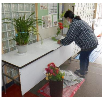
玄関はいつも花が満開