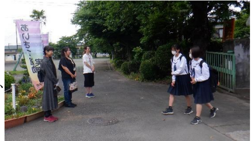
自然と笑顔になります

毎週月曜日の朝に正門でのあいさつ運動では、「おはようございます」「行ってらっしゃい」の温かい声かけのおかげで、さわやかな気持ちで一週間をスタートすることができます。