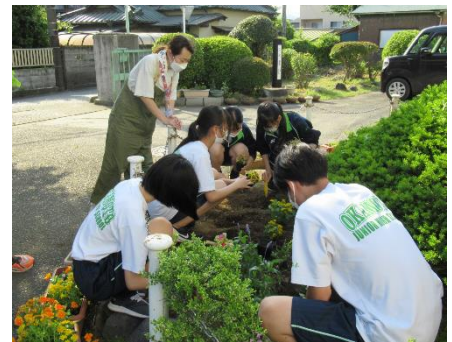
生徒と一緒に花壇の整備

プランターの花植えや花壇の整備、草むしりなどの作業にご協力をいただいています。5月には生徒と一緒に昇降口前などの花壇の整備をしました。グラウンド横の花壇に植えたヒマワリはスクスクと育ち、もうすぐ花を咲かせそうです。