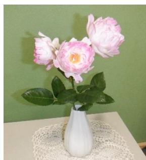
校長室の見事なバラ