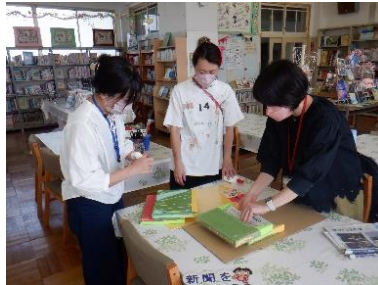
新聞入れを作成中

図書室の季節の飾りつけや本の修整整理などに取り組んでいただいています。オススメの本が見やすく展示されていて、昼休みにも多くの生徒が読書を楽しんでいます。