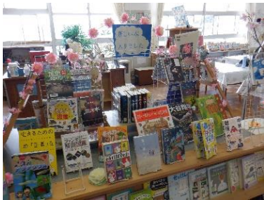
思わず手にしたくなります